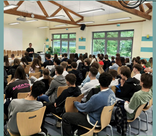
Siebenpfeiffer-Gymnasium in Kusel