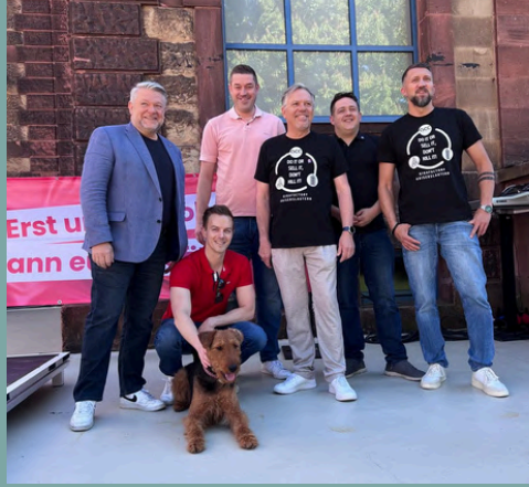
1.Mai-Kundgebung in Kaiserslautern