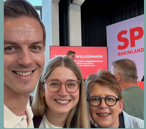
Landesparteitag der SPD Rheinland-Pfalz in Nieder-Olm