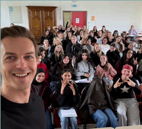
St. Franziskus Realschule Plus in Kaiserslautern