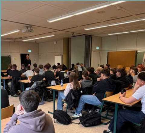
Realschule Plus in Kusel