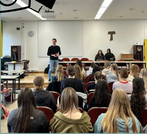
St.Franziskus Gymnasium in Kaiserslautern